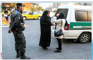
وجود دارد و آسیب می‌زند وی با اشاره به تصویب کلیات لایحه حمایت از زنان، عنوان کرد: شاهد

تصویب این لایحه بودید خوشبختانه مادر مجلس شورای اسلامی لایحه‌ای که دولت در بحث حمایت از بانوان در برابر آسیب‌های اجتماعی فرستاده بود را بررسی کردیم و همراهی بسیاری خوبی را قاطبه نمایندگان مجلس با این موضوع داشتند و من فکر می‌کنم پیام بسیار خوبی در باره نوع نگاه مجلس به بانوی ایرانی مخابره شد.