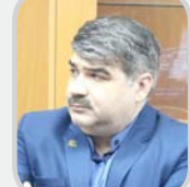
سید کامران یگانگی

بخشنامه قسوه قضاییه درباره عدم صلاحیت دیوان عدالت اداری در رسیدگی به دعاوی ناشی از تصمیمات مراجع دانشگاهی در شرایطی خاص و با توجه به لزوم تقویت استقلال نهادهای دانشگاهی صادر شد و پیامدهای مهمی برای نظام آموزش عالی و حقوق دانشگاهیان و دانشجویان به همراه دارد. رئیس قوه قضاییه سیزدهم آذر ۱۴۰۳، بخشنامه‌ای صادر کرد که در آن به وضوح اعلام گردید تصمیمات و آرای هیات‌ها و کمیته‌های دانشگاهی و آموزشی از جمله هیات‌های امناء، هیات‌های ممیزه، هیات‌های انتظامی اساتید و دیگر مراجع مرتبط از دایره صلاحیت دیوان عدالت اداری خارج شد. نظام تصمیم‌گیری در دانشگاه‌ها و مراکز علمی همواره در تقاطع سیاست‌های دولتی، قضایی و اجرایی قرار داشته است. در گذشته، بسیاری از تصمیمات از جمله جذب اعضای هیات علمی، تأسیس کمیته‌های انضباطی، نحوه پذیرش دانشجو و حتی ارزیابی‌های علمی تحت نظارت یا بررسی‌های قضایی قرار داشتند. دیوان عدالت اداری به عنوان مرجعی برای رسیدگی به اعتراضات و دعاوی نسبت به این تصمیمات عمل می‌کرد. اما تصمیم اخیر در راستای تقویت استقلال دانشگاه‌ها و حذف نظارت قضایی مستقیم بر برخی از این تصمیمات، دگرگونی اساسی را در شیوه تعامل نهادهای دانشگاهی و قضایی رقم زده است. این تحول، فارغ از نگرانی‌هایی که در مورد عدم نظارت قضایی در برخی امور به وجود آمده، می‌تواند به ایجاد فضایی آزادتر و مستقل‌تر برای فعالیت‌های آموزشی و پژوهشی کمک کند.