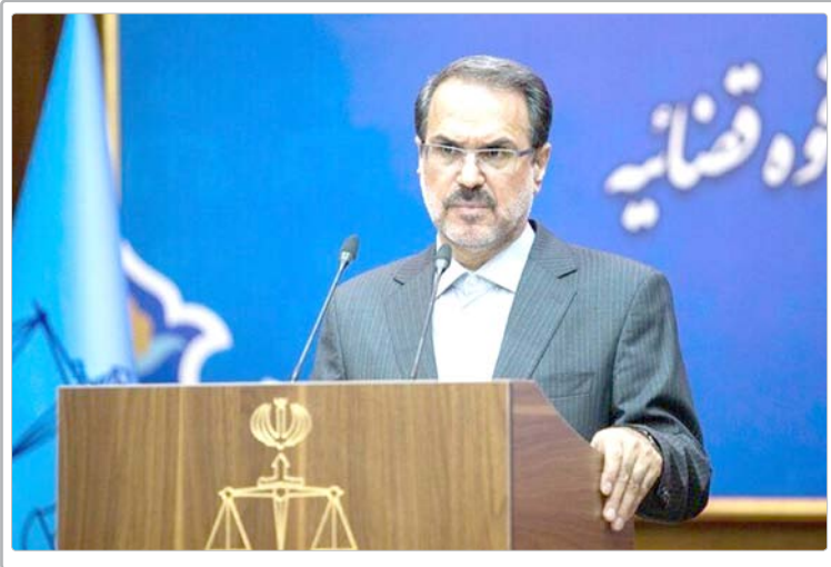
حوزه تولید رانخستین مأموریت این سازمان عنوان کرد.

رئیس سازمان بازرسی کل کشور ادامه داد: نظارت مستمر بر عملکرد دستگاه ها در انجام این تکالیف و شناسایی و رفع موانع تولید در