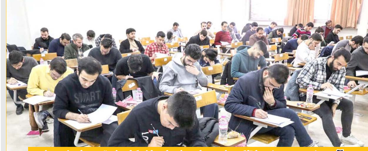
وزیر آموزش و پرورش با تأکید از حمایت از بازماندگان از تحصیل خبر داد: