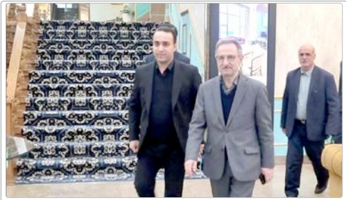
معاون گردشگری کشور در پایش میدانی خدمات اقامتی مطرح کرد.

در واحدهای اقامتی این مناطق، خاطر نشان کرد: روحیه همدلی، همراهی و مسئولیت‌پذیری در میان مدیران و کارکنان تأسیسات گردشگری بسیار بالاست و استانداردهای حرفه‌ای میزبانی به‌خوبی رعایت‌می‌شود.