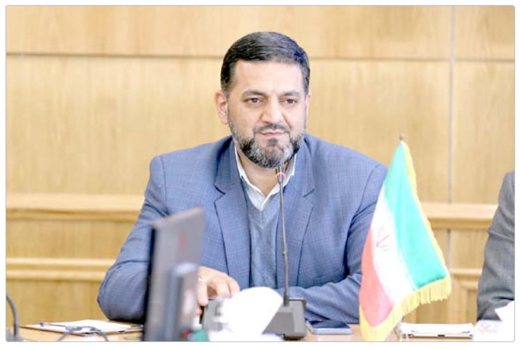
در کنکور ۱۴۰۵ «مثبت» شود

وی ادامه داد: در چنین شرایطی لازم است تصمیماتی اتخاذ شود که از نظر روانی و آموزشی به دانش‌آموزان کمک کند. به نظر می‌رسد یکی از تصمیمات منطقی این است که رئیس جمهور به عنوان رئیس شورای عالی انقلاب فرهنگی با استفاده از اختیارات خود، برای کنکور سال ۱۴۰۵ تأثیر پایه‌یازدهم را به صورت مثبت اعلام کند.